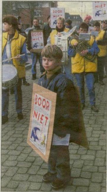
Ook damesband Vals mar leutig protesteerde tegen de gasboringen.

gehaakt door een agent in burger. Later kreeg hij van diezelfde politieman te horen: „Wij noemen dat de angel uit de actie halen.”